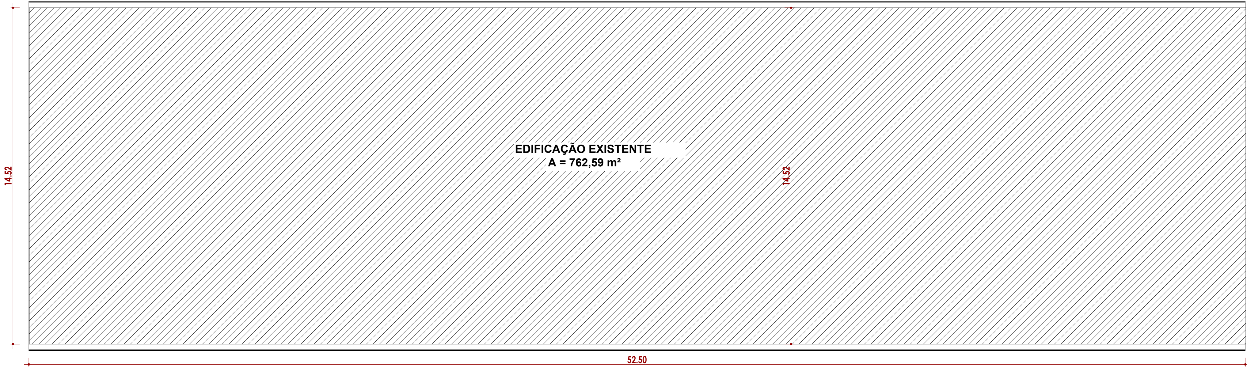
PLANTA DE IMPLANTAÇÃO ESCALA.: 1/100